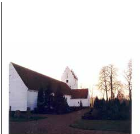
Nr. 1 september, oktober, november 2002 1. årgang

Den 2. september 2002 udkom Åsum Sogneblad for første gang og kan således nu fejre sit 20-års jubilæum.