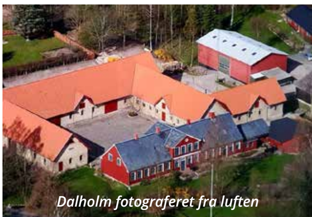
Dalholm fotograferet fra luften