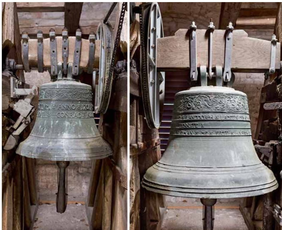
Åsum Kirkes klokker, støbt af Conrad Kleimann, Lübeck, i 1701 og 1702. Ringningen blev automatiseret i 1960.

ørerne! Kun en nådig skaber forhindrede, at jeg fik varige høreskader! Og skulle een og anden i Åsum i dag synes, at jeg ikke altid er helt med i en samtale, så er det altså DERFOR!