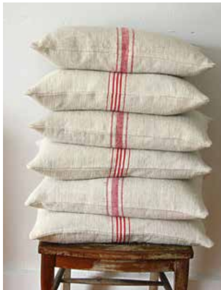
Melsække kunne genbruges som viskestykker og pudebetræk

Der var også lager af forskellige oste, runde og firkantede. De skulle vendes jævnligt af hensyn til lagring. Disse oste kunne godt give en særlig lugt, især de gamle oste. I kælderen var der anbragt hylder til opbevaring af service (lånetøj kaldte vi det). Lånetøjet var engelsk fajance blåmønstret fra ca. år 1930-32. Mange forretninger især på landet havde udlejning af service til kunderne. Kunderne kunne låne