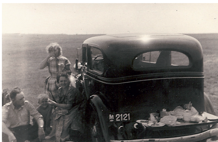
Min farfars gamle Ford.