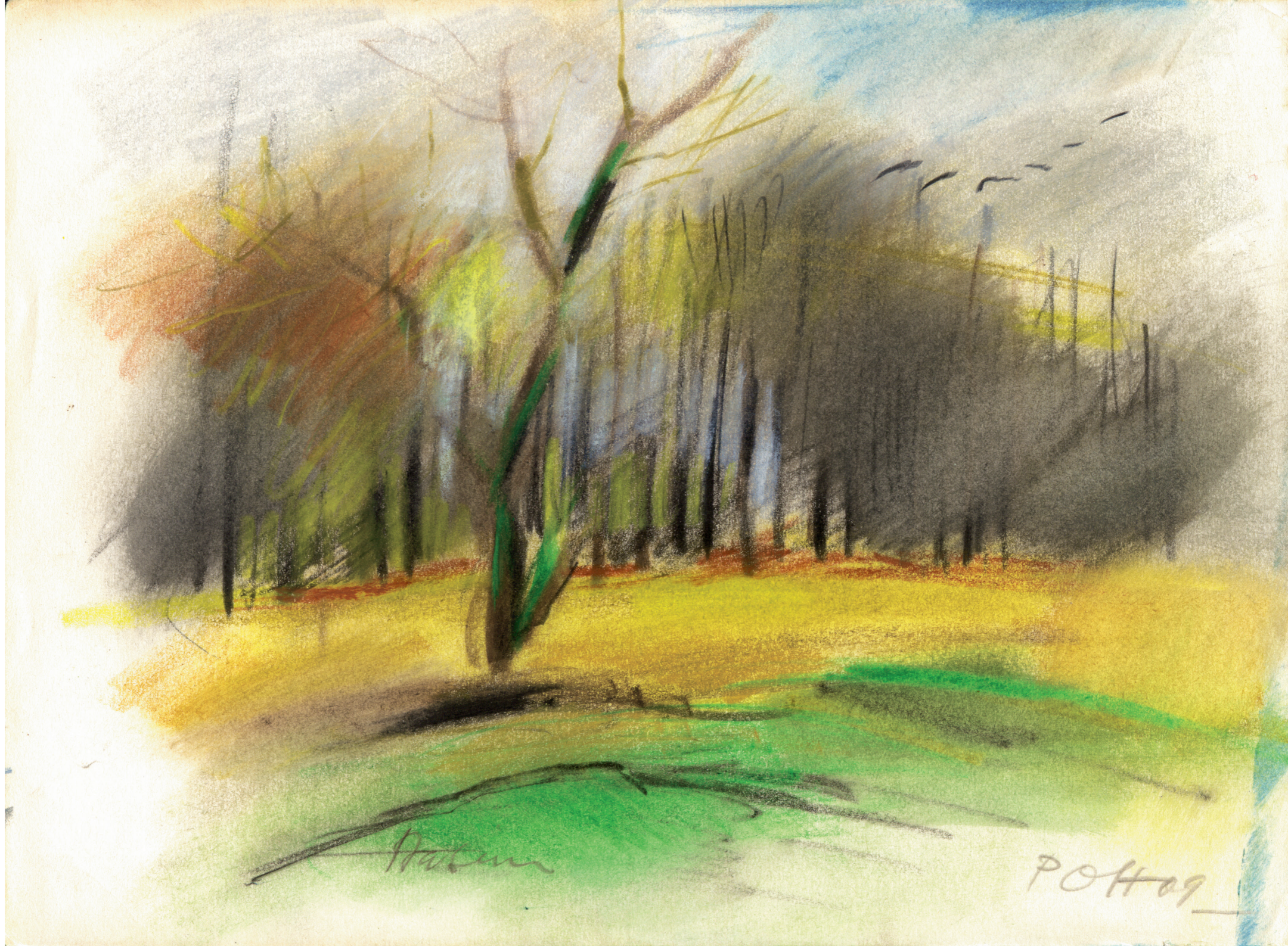
Farvekridttegning af P.O. Hansen, 2009. 21 x 29,7