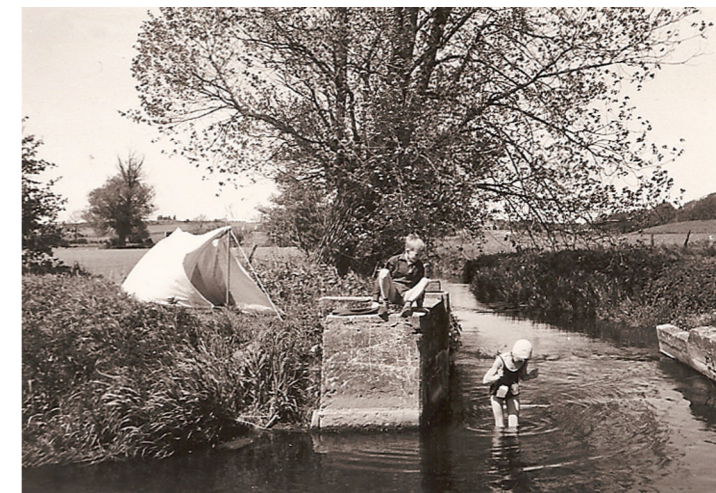
Vi slog telt op ved slusen og badede i åen.

være, at en af de andre havde. Jeg måtte dog indhente speciel tilladelse hjemme for at gå helt op til købmand Bruun for at købe esser. Man skulle op ad Åsumvej, der var brolagt helt ind til Odense, over åen og forbi en firlænget, stråttækt gård, der lå dér, hvor dueslagene ligger i dag. Lidt efter gården havde Bruun sin forretning i et hvidt hus, hvor man skulle nogle trin op ad en lille trappe med sort jerngelænder for at komme ind i butikken.