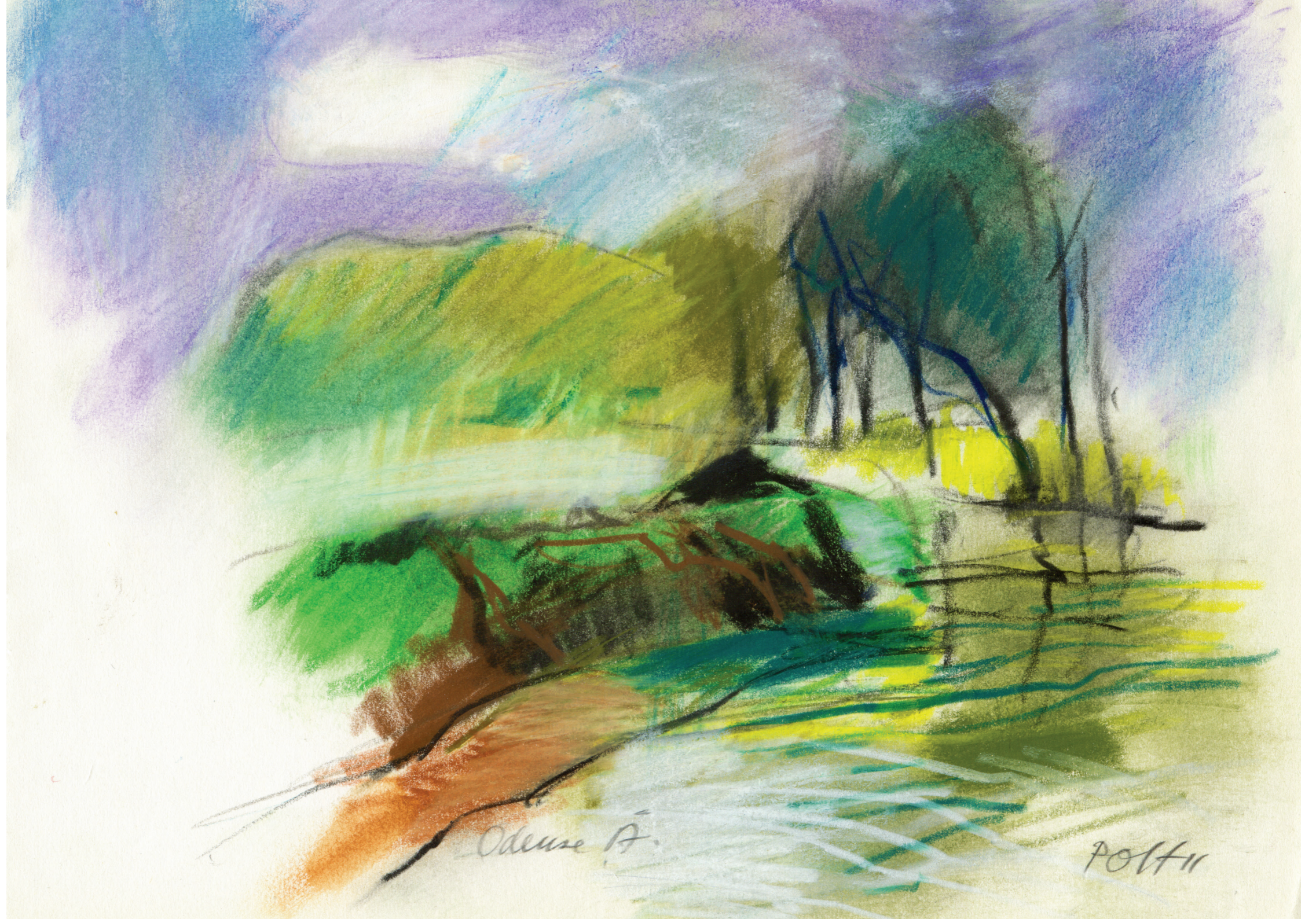
Farvekridttegning af P.O. Hansen, 2011. 21 x 29,7