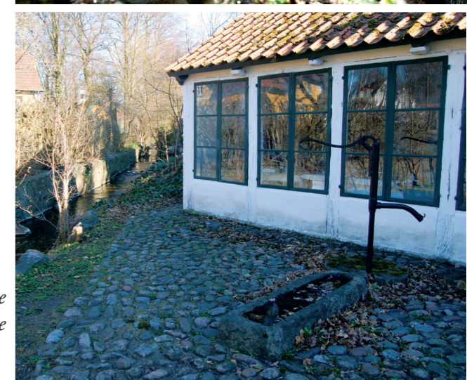
Den gamle smedie