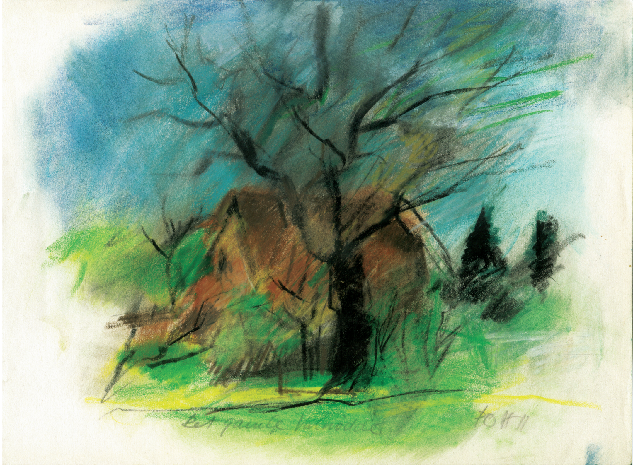
Farvekridttegning af P.O. Hansen, 2011. 21 x 29,7