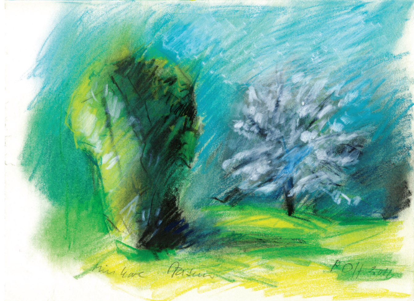
Farvekridttegning af P.O. Hansen, 2011. 21 x 29,7