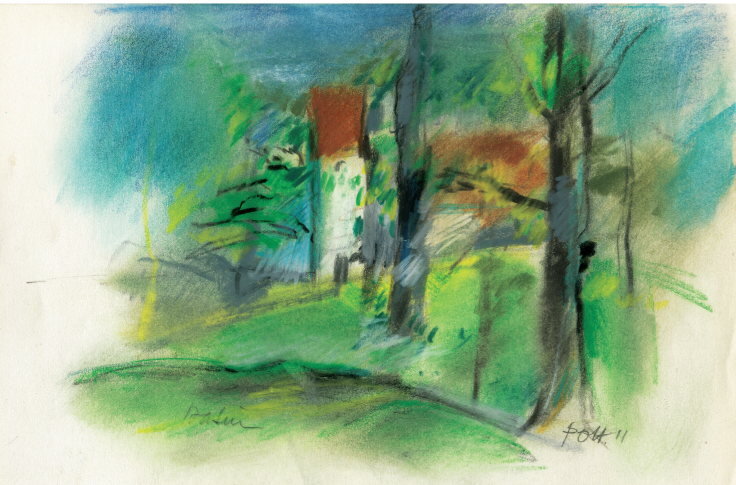
Farvekridttegning af P.O. Hansen, 2011. 21 x 29,7