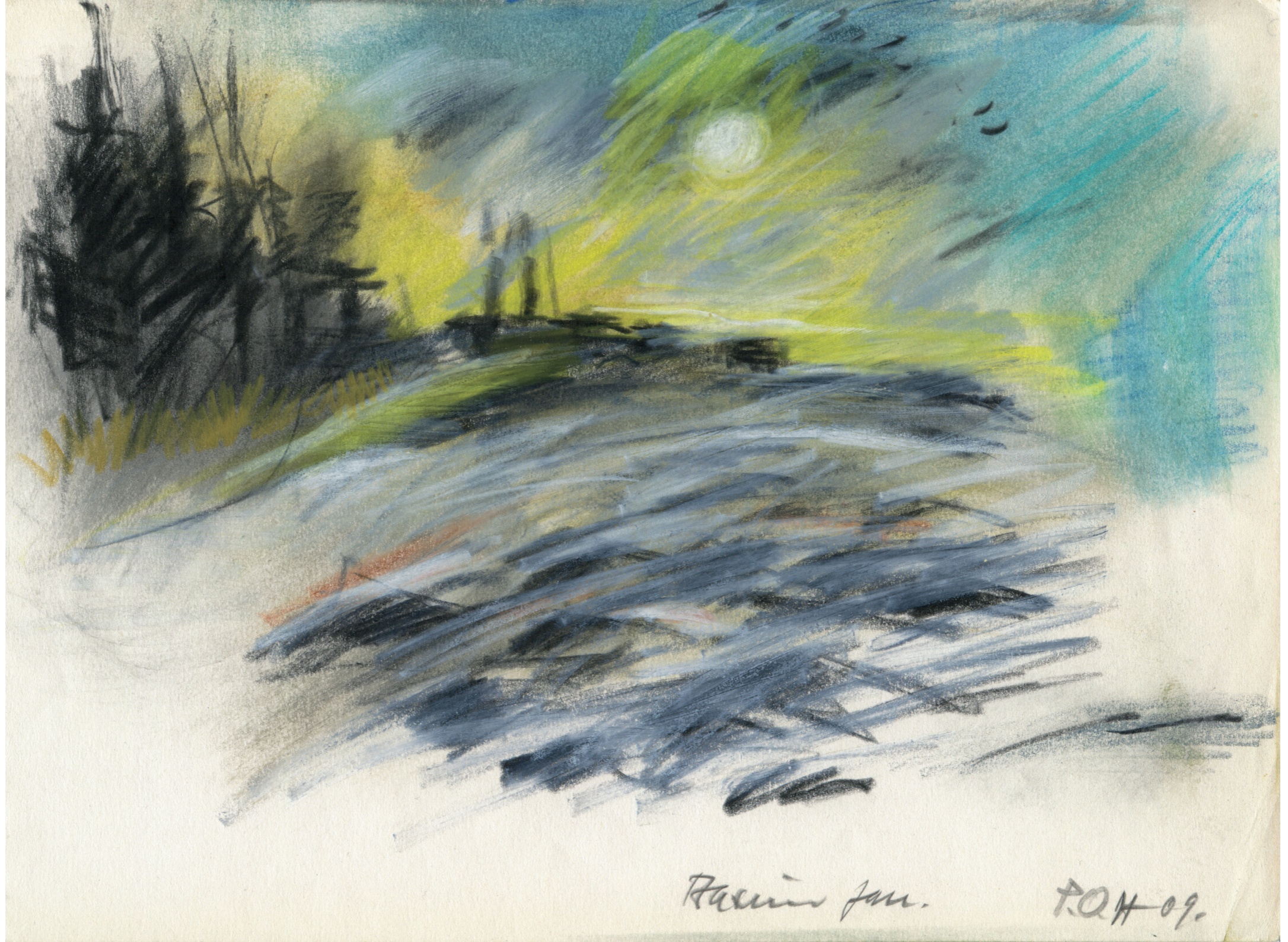
Farvekridttegning af P.O. Hansen, 2009. 21 x 29,7