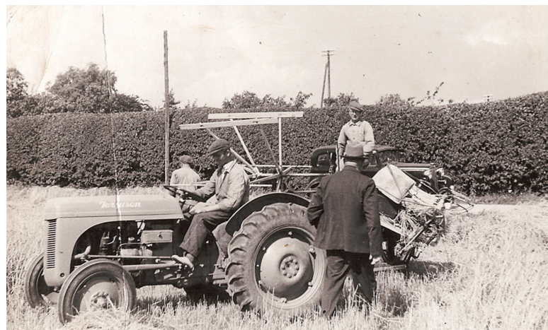
Høst med gamle maskiner - min far på en selvbinder.

alle gårde mødte hele familien og gårdens karle og piger op til fest-aftenen i det fint pyntede forsamlingshus. Spisningen blev holdt i den store sal, hvor der var lange rækker af borde dekoreret med blomster og korn.