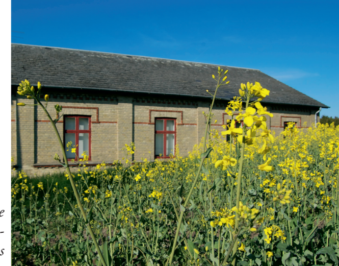
Det gamle forsamlingshus