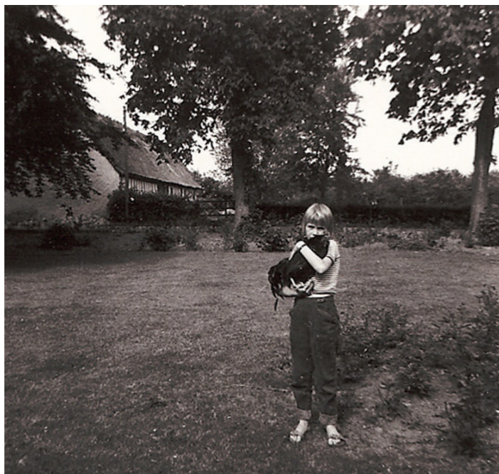
Jeg står i haven med min tamme dværghane.