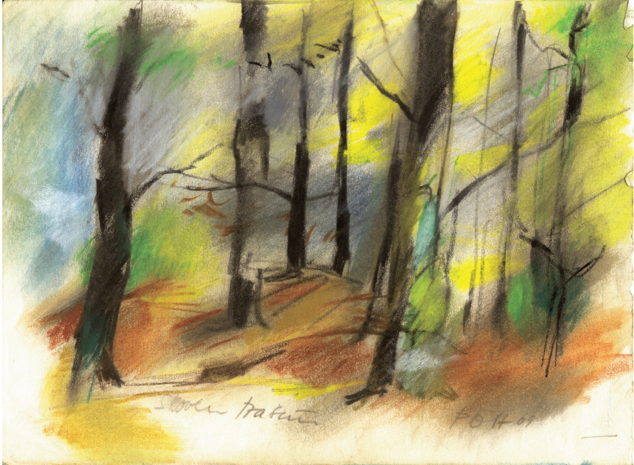
Farvekridttegning af P.O. Hansen, 2009. 21 x 29,7