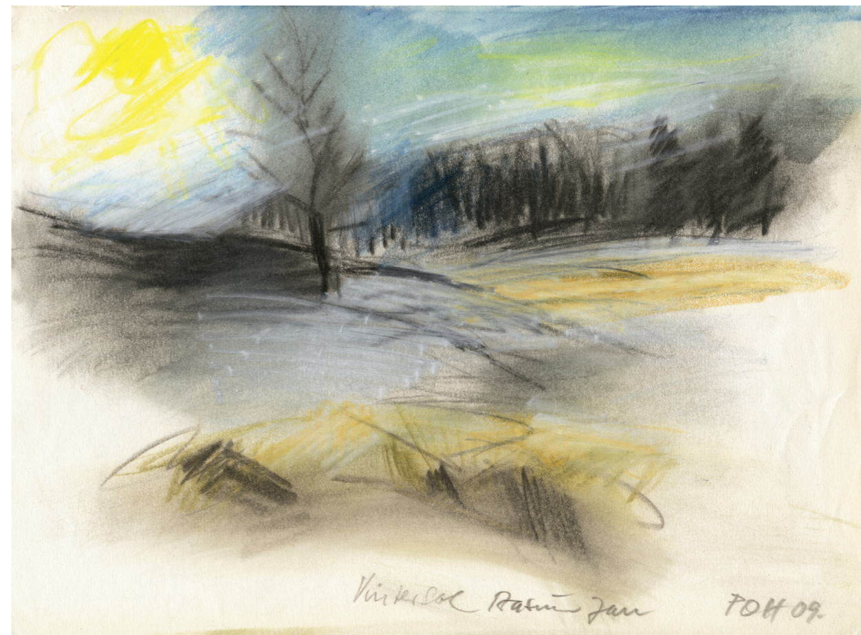
Farvekridttegning af P.O. Hansen, 2009. 21 x 29,7