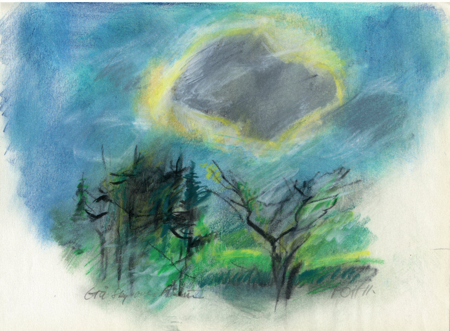
Farvekridttegning af P.O. Hansen, 2011. 21 x 29,7