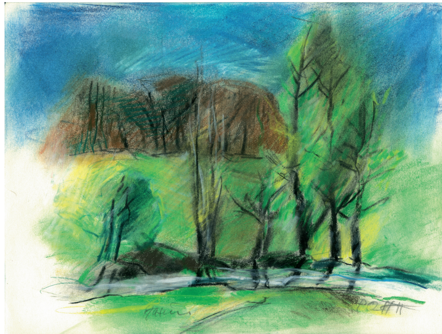
Farvekridttegning af P.O. Hansen, 2011. 21 x 29,7