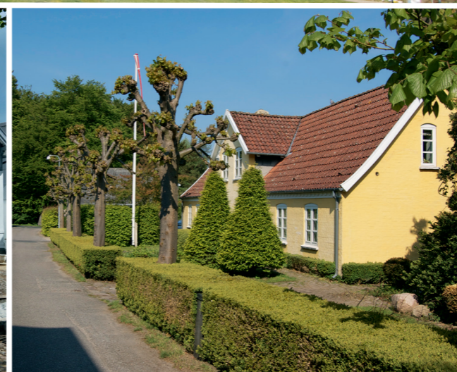
Det gamle kommune-kontor