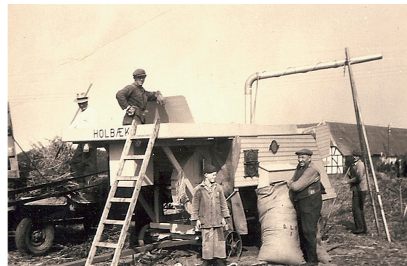
Høst med gamle maskiner og tærskværk på marken.