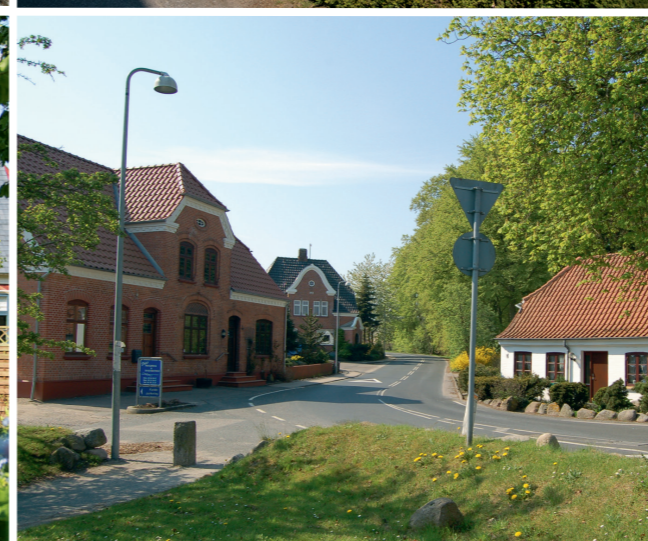
De gamle købmands-huse