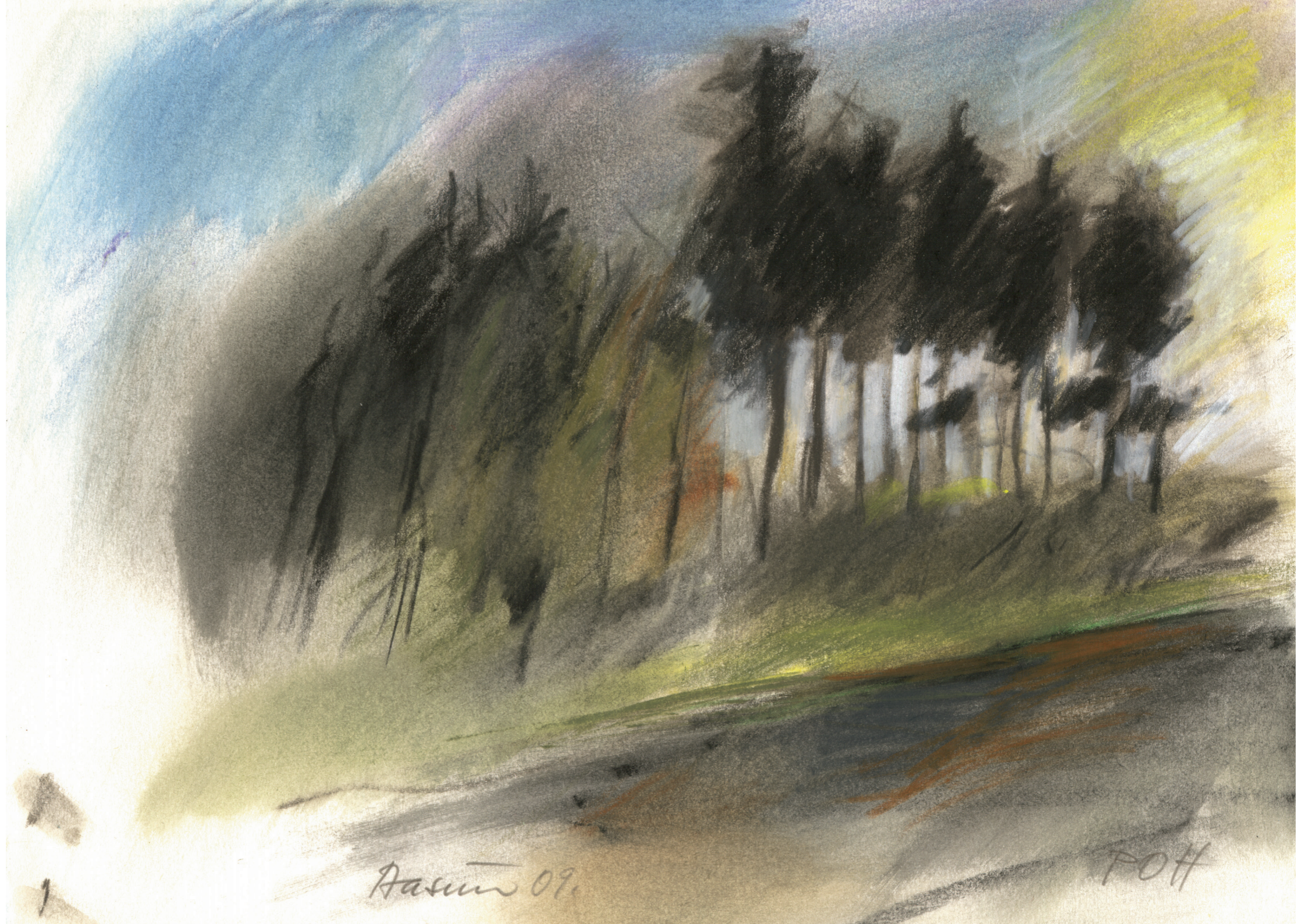
Farvekridttegning af P.O. Hansen, 2009. 21 x 29,7